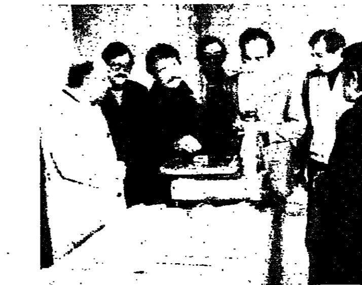
عملية وزن الطرود والرسائل

ان يأتي الى مركز البريد وفي يده رسالة مفتوحة . تاليا : يتم اقبال الرسالة بحضور موظف البريد وتحت اشرافه ، دون ان يكون له حق الاطلاع عليها . او قرأتها ثم تلصق عليها التمغة البريدية وتضم بحضور صاحبها . وايقام الرسائل مفتوحة على هذا النحو ، هو ادواج اجنية ، حيث يثنى للوقوف التثبت من عدم وجود اشياء ممنوعة داخل الرسالة . والرسم الملقى على كل رسالة ، او « طابع البريد » لا يزال كما كان في السابق : من ٧٥ ل.١٠٠ قبل .